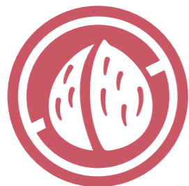
Fruits à coque Nuts